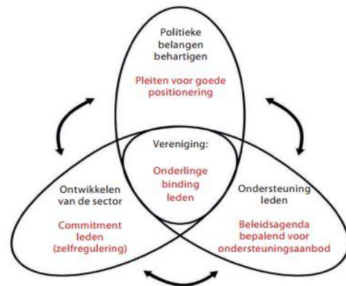
Figuur 1: Het Propellermodel Tack

Een vereniging kan zich richten op het behartigen van belangen, het ontwikkelen van de sector en het verlenen van diensten, zoals hiernaast in het Figuur is af te lezen (Bron: Professioneel Verenigingsmanagement. Peter Tack). Dit model is ontwikkeld door Tack en Huizingh en is één op één toepasbaar op het verenigingsmodel in de sport of andere sectoren. De ASF heeft zich tot op heden voornamelijk gericht op belangenbehartiging van de Arnhemse sportaanbieders. Om de sportsector in Arnhem echter verder te versterken, wil de ASF ook bijdragen aan de doorontwikkeling van de sector. Daarnaast blijft de ASF zich inzetten om belangen te behartigen van de Arnhemse sportaanbieder.