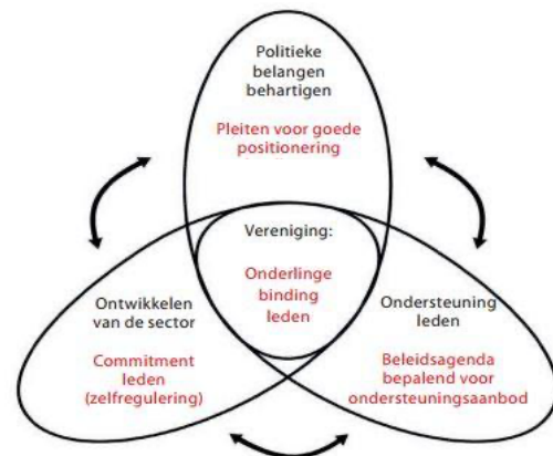
Figuur 1: Het Propellermodel Tack

Een vereniging kan zich richten op het behartigen van belangen, het ontwikkelen van de sector en het verlenen van diensten, zoals hiernaast in het Figuur is af te lezen (P.J.Tack en P.M.M.M Beusmans Professioneel Verenigingsmanagement: voor besturen en directeuren van branche- en beroepsverenigingen, 2001) Dit model is ontwikkeld door Tack en Huizingh en is één op één toepasbaar op het verenigingsmodel in de sport of andere sectoren. De ASF heeft zich tot op heden voornamelijk gericht op belangenbehartiging van de Arnhemse sportaanbieders. Om de sportsector in Arnhem echter verder te versterken, wil de ASF ook bijdragen aan de doorontwikkeling van de sector. Daarnaast blijft de ASF zich inzetten om belangen te behartigen van de Arnhemse sportaanbieder.